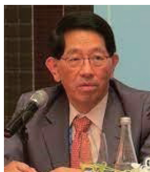
高志尚董事長小檔案